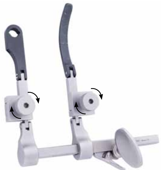
02-72-812 Gegensperrer mit Doppelgelenk und tiefenverstellbaren Armen, schwarz, titanbeschichtet