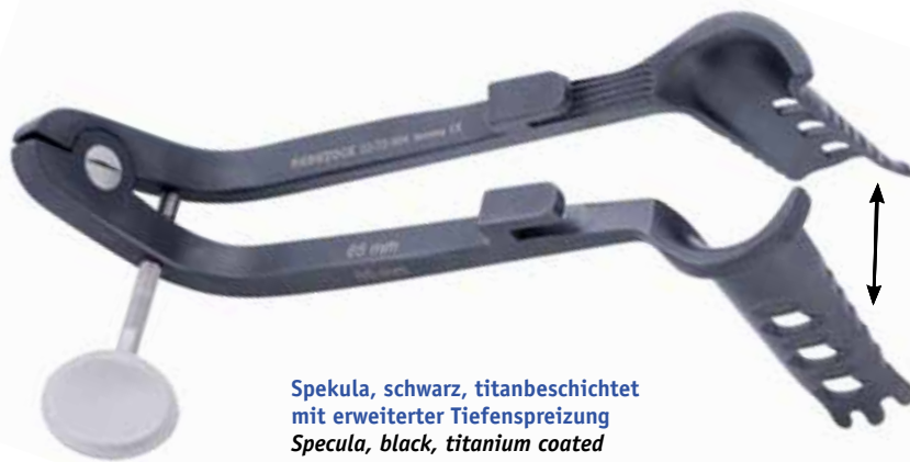
Spekula, schwarz, titanbeschichtet mit erweiterter Tiefenspreizung Specula, black, titanium coated with extended deep spreading