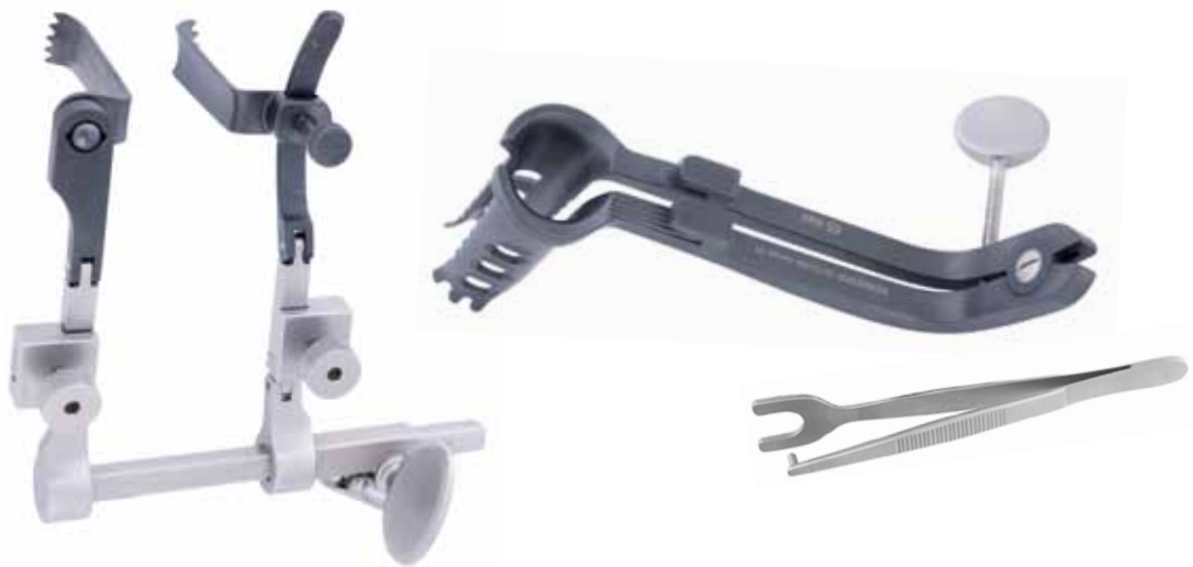
06-57-170 REBSTOCK Mikrodiskektomie Retraktor Set mit erweiterter Tiefenspreizung bestehend aus: